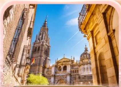
มหาวิหารแห่งโทเลโด