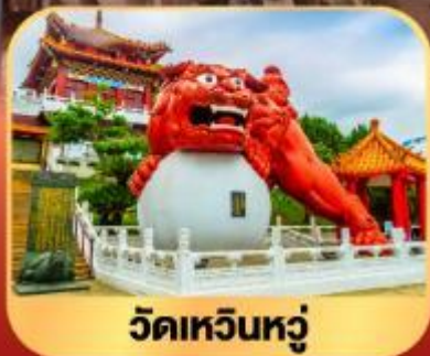
วัดเหวินหนู่