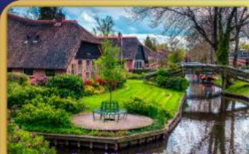
ล่องเรือหมู่บ้านไรทอนท์ธูร์น