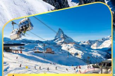
นั่งกระเช้าชมแมทเทอร์ฮอร์น