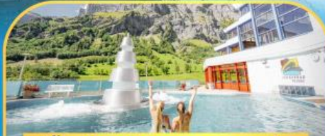
แช่น้ำแร่ร้อนผ่อนคลายลวยคอร์บิค