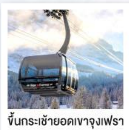
ขึ้นกระเช้ายอดเขาจุงเฟรา