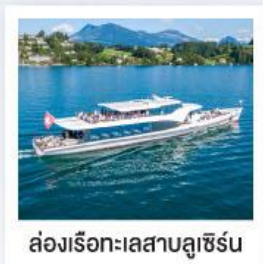
ล่องเรือทะเลสาบลูซีร์น