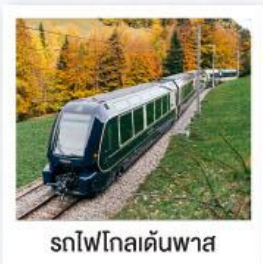
รถไฟโกลด์นพาส