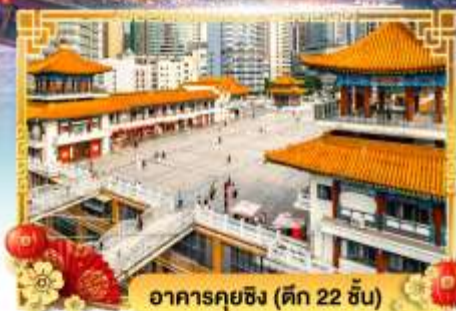
อาคารคุยซิง (ดิค 22 ชั้น)