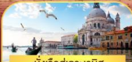
นั่งเรือสุทเกาะเวนิส