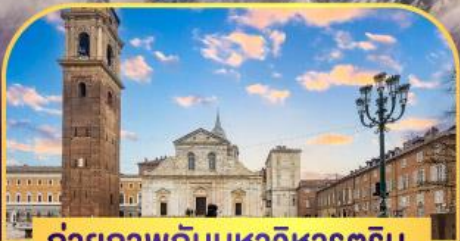
ถ่ายภาพกับมหาวิหารตูริน