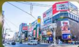
ซูซุกิโนะ