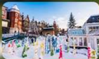
โรงงานช็อกโกแลต ชิโรอิ โคอิบิโตะ