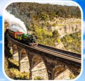
ZIG ZAG RAILWAY

เปิดประสบการณ์ ตามหายักษ์ใหญ่แห่งท้องทะเล ล่องเรือ "CATAMARAN" ชมวาฬ