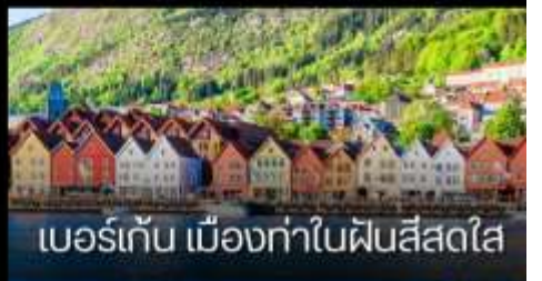
เบอร์เก้น เมืองท่าในฟินส์สไต