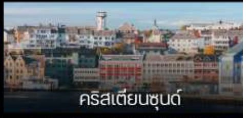
คริสเตียนซุนด์