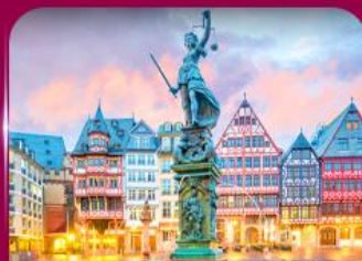
จัตุรัสโรเมอร์ แพรงก์เฟิร์ต