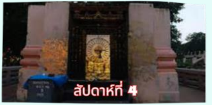
รัตนขรรเจดีย์ (ซุ้มเรือนแก้ว)

เรียบร้อยแล้ว นำคณะจาริกบุญสวดมนต์ทำวัตรเย็น บูชาพระรัตนตรัย และสวดมนต์บูชาสังเวชนียสถาน จากนั้นเชิญท่านทัศนารธรรม นั่งสมาธิปฏิบัติบูชาตามอธยาศัย สมควรแก่เวลา นัดหมายเวลาเชิญท่านกลับโรงแรมที่พัก