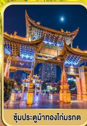
ซุ้มประตูม้าทองไถ่มรดก