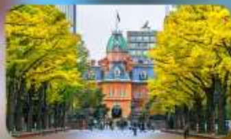
อัสระ:ตามอัสยาฬย 1 วัน