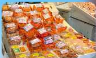
ตลาดปลาโจโก