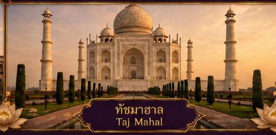
ทัชมาฮาล Taj Mahal