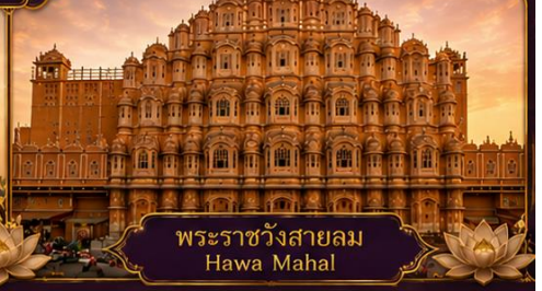
พระราชวังสายลม Hawa Mahal