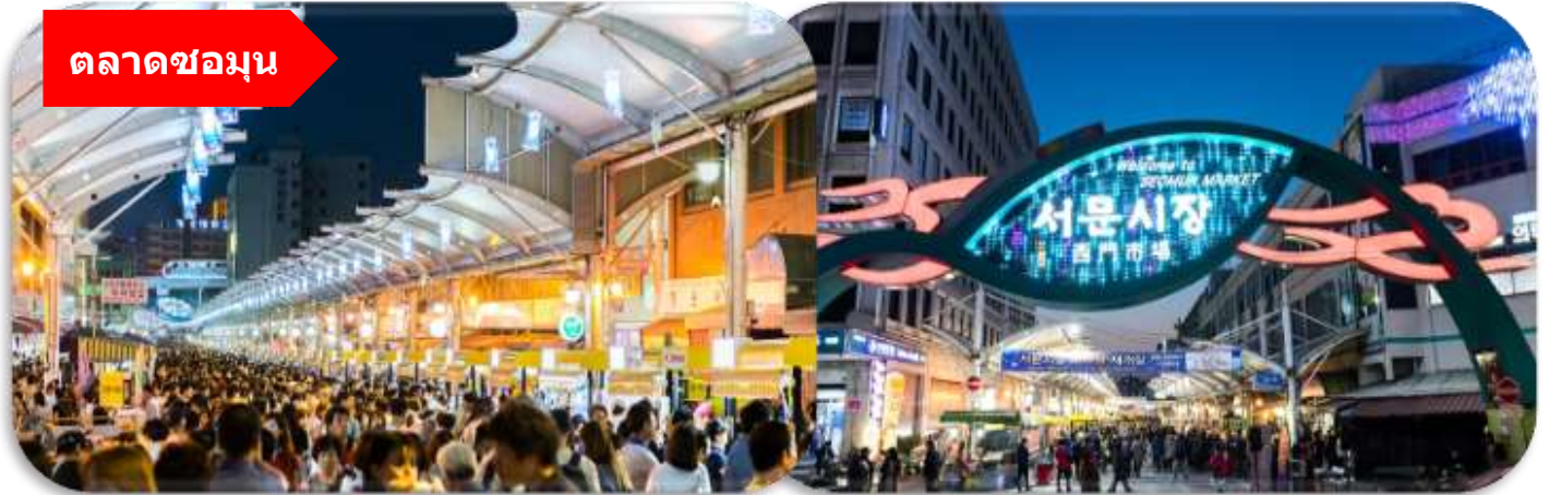
ตลาดชอมุน

นำท่านเที่ยวชม ตลาดชอมุน (Seomun Market) ตลาดพื้นเมืองชื่อดัง ที่มีประวัติยาวนานตั้งแต่สมัยโชซอน และถือเป็นหนึ่งในตลาดดั้งเดิมที่ใหญ่ที่สุดของเกาหลีใต้ ภายในเต็มไปด้วยของกินสตรีทฟู้ด ร้านผ้า เสื้อผ้า ของฝาก และบรรยากาศท้องถิ่นแบบเกาหลีแท้ ๆ ไฮไลท์ห้ามพลาดคือ "ตลาดกลางคืน" ที่คึกคักไปด้วยอาหารพื้นเมืองสุดอร่อย เช่น มันทูแป็งเกี้ยวแบน และดอกกบก็