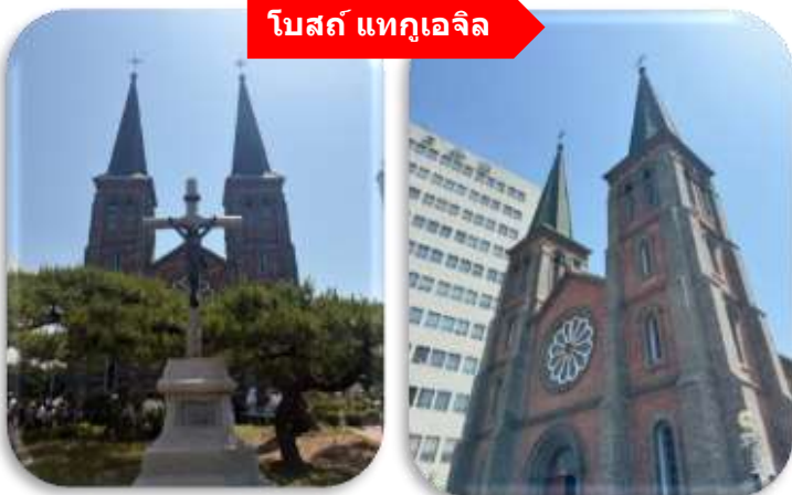
โบสถ์ แทกูเจิล

นำท่านเที่ยวชม โบสถ์แทกูเจิล โบสถ์นิกายโปรเตสแตนต์ที่เก่าแก่ที่สุดใน จังหวัดคยอซังบุก (Gyeongsangbuk-do) ตั้งอยู่ในบริเวณ Cheongna ซึ่งเป็นย่านที่อยู่อาศัยของเหล่ามิชชันนารีที่มาอาศัยอยู่ใน เมืองแทกู