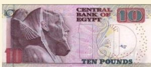
100 ปอนด์อียิปต์