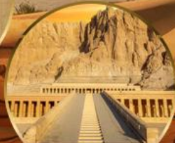
หุบเขากษัตริย์