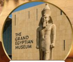
พิพิธภัณฑ์แกรนด์อียิปต์