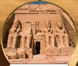
วิหารอาบูซิมเบล