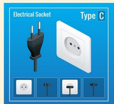
ปลั๊กไฟที่ใช้ที่อียิปต์