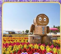
สวนซึกิไซโนะโอกะ