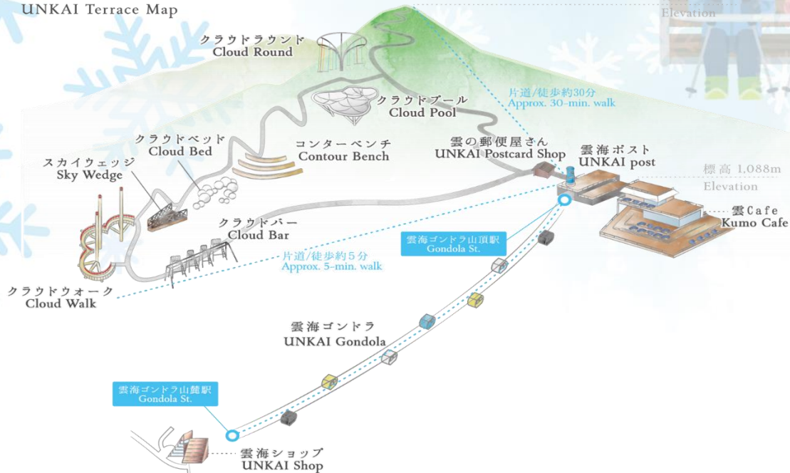
雲海テラスマップ UNKAI Terrace Map

เดินทางสู่ เมืองอาซาฮิคาว่า เป็นเมืองที่ใหญ่เป็นอันดับสองของเกาะฮอกไกโด รองจากนครซัปโปโระมีร้านค้าที่ขายข้าวและผักที่ปลูกได้ในเมือง และยังมีร้านอาหารทะเลตั้งอยู่มากมาย การคมนาคมสมบูรณ์แบบ ทำให้แต่ละปีมีผู้มาท่องเที่ยวกว่า 5 ล้านคนจากทั้งในและต่างประเทศ