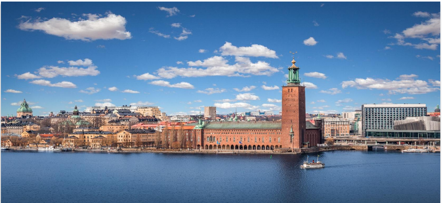
STOCKHOLM CITY HALL

จากนั้นนำทุกท่านชม ศาลาว่าการเมืองสต็อกโฮล์ม (Stockholm City Hall) ซึ่งเป็นสถานที่จัดงานเลี้ยงอันทรงเกียรติสำหรับผู้ได้รับรางวัลโนเบลที่มีชื่อเสียงไปทั่วโลก พิธีมอบรางวัลโนเบลจะจัดขึ้นในเดือนธันวาคมของทุกปี ตัวอาคารแห่งนี้สร้างขึ้นจากอิฐแดงกว่า 8 ล้านก้อน ใช้เวลาก่อสร้างยาวนานถึง 12 ปี แล้วเสร็จในปี ค.ศ. 1911 ภายในอาคารมีห้องโถงที่ตกแต่งอย่างงดงาม โดยเฉพาะ “ห้องต้นรำ” ที่ประดับผนังด้วยลวดลายหิน