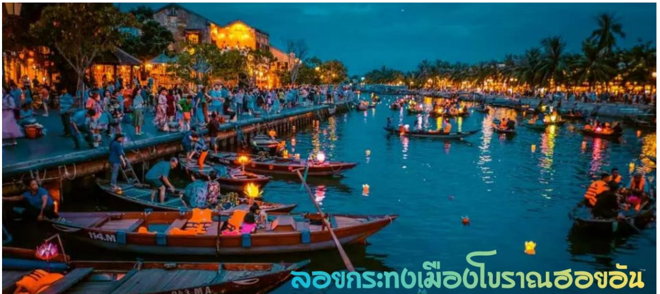
ล่องกระทงเมืองโบราณฮอยอัน

นำท่าน ล่องเรือลอยกระทง ในแม่น้ำหว่าย และเพลิดเพลินไปทิวทัศน์ของเมืองโบราณฮอยอันในยามค่ำคืน