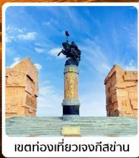
เขตท่องเที่ยวเจงกิสข่าน