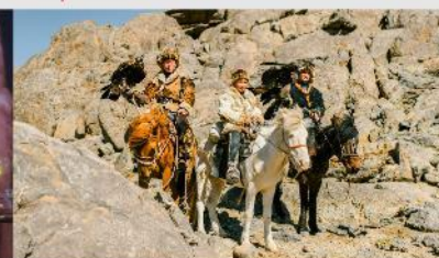
ชนเผ่ามองโกล

*ทางบริษัทฯ ขอสงวนสิทธิ์ในการสลับโปรแกรมทัวร์ตามความเหมาะสมขึ้นอยู่กับสถานการณ์หน้างาน โดยคำนึงถึงผลประโยชน์ของลูกค้าเป็นสำคัญ