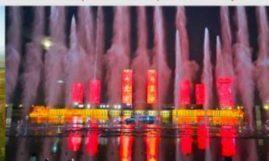
น้ำพุคังปาสื่อ