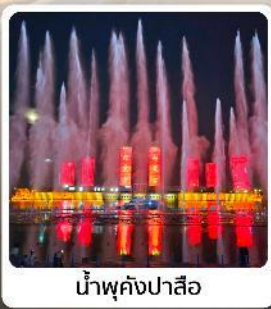
น้ำพุคังปาสือ