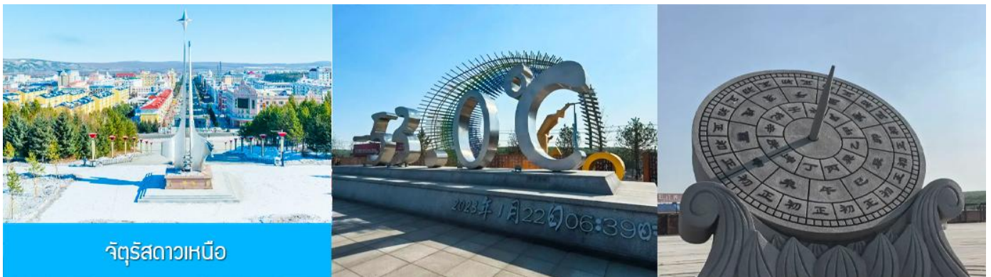
จัตุรัสดาวเหนือ