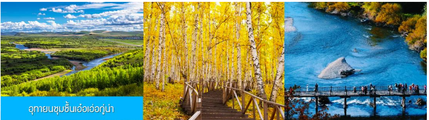
อุทยานชุ่มชื้นเอ้อเอ่อกู่่น่า

เช้า รับประทานอาหารเช้า ณ ห้องอาหารของโรงแรม (16)