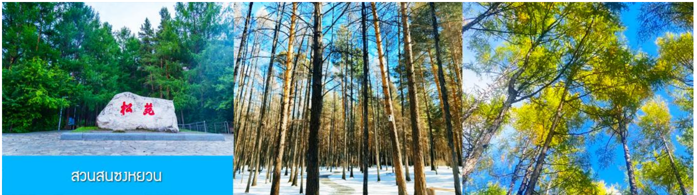
สวนสนขงหยวน

เช้า รับประทานอาหารเช้า ณ ห้องอาหารของโรงแรม (22)