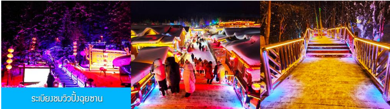
ระเบียงชมวิวยิ่งจู่ซาน

นำท่านสู่ระเบียงชมวิวยิ่งจู่ซาน 棒槌山观光栈道 เป็นระเบียงทางเดินชมวิวมุ่บ้านหิมะบนเนินที่ทำด้วยไม้ มีความยาว 3,200 เมตร ระเบียงทางเดินชมวิวนี้นี้ได้พาดผ่านจุดชมวิวยาวงาม ต่าง ๆ ที่สามารถมองเห็นทัศนียภาพที่สวยงามของเมืองในเทพนิยายในมิติและมุมมองที่หลากหลาย เป็นที่นิยมของนักท่องเที่ยวที่ชื่นชอบการถ่ายภาพเป็นอย่างยิ่ง เพราะระเบียงทางเดินชมวิวมียุ่มสวย ๆ ให้ถ่ายรูปตลอดเส้นทาง, เดินบนระเบียงไม้มีค่าใช้จ่ายใด ๆ ท่านสามารถเดินชมวิวดำตามอัธยาศัย จนอิ่มใจ