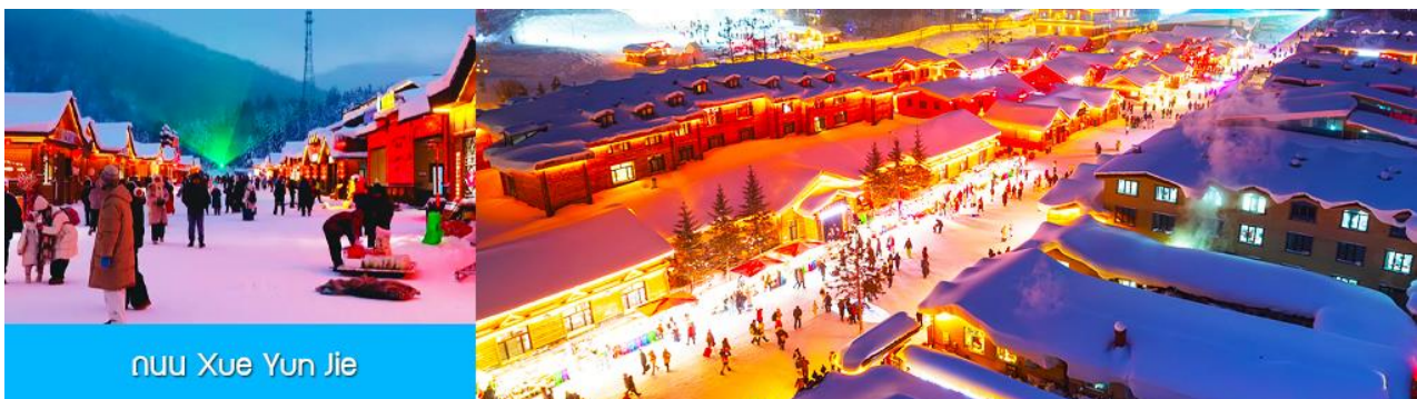
ถนน Xue Yun Jie

นำท่านสู่ระเบียงชมวิวยิ่งจู่ซาน 棒槌山观光栈道 เป็นระเบียงทางเดินชมวิวมุ่บ้านหิมะบนเนินที่ทำด้วยไม้ มีความยาว 3,200 เมตร ระเบียงทางเดินชมวิวนี้นี้ได้พาดผ่านจุดชมวิวยาวงาม ต่าง ๆ ที่สามารถมองเห็นทัศนียภาพที่สวยงามของเมืองในเทพนิยายในมิติและมุมมองที่หลากหลาย เป็นที่นิยมของนักท่องเที่ยวที่ชื่นชอบการถ่ายภาพเป็นอย่างยิ่ง เพราะระเบียงทางเดินชมวิวมียุ่มสวย ๆ ให้ถ่ายรูปตลอดเส้นทาง, เดินบนระเบียงไม้มีค่าใช้จ่ายใด ๆ ท่านสามารถเดินชมวิวดำตามอัธยาศัย จนอิ่มใจ