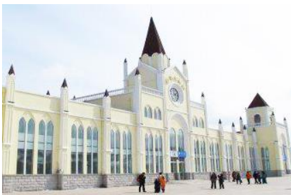
สถานีรถไฟยาบูลี

หมายเหตุ เพื่อความสะดวกในการเข้าพักใน HOME STAY ภายในหมู่บ้านหิมะ ทางทัวร์แนะนำให้ท่านจัดเตรียมเสื้อผ้าและเครื่องใช้เท่าที่จำเป็น 1 ชุดใส่กระเป๋าใบเล็กหรือเป้แบบสะพายได้ เพื่อสะดวกในการนำติดตัวไปใช้สำหรับคืนที่นอนในหมู่บ้านหิมะ หากนำกระเป๋าเดินทางใบใหญ่เข้าสู่ที่พักในหมู่บ้านอาจสร้างความไม่สะดวกแก่ท่าน จึงไม่แนะนำ