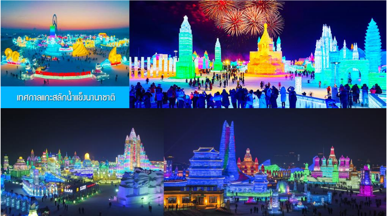
เทศกาลแกะสลักน้ำแข็งนานาชาติ

รับประทานอาหารค่ำ ณ ภัตตาคาร *สุกี้* (14)