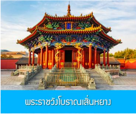
พระราชวังโบราณเสียนหยาง

รับประทานอาหารเช้า ณ ห้องอาหารของโรงแรม (1)