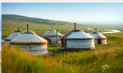
ที่พักแบบกระโจม