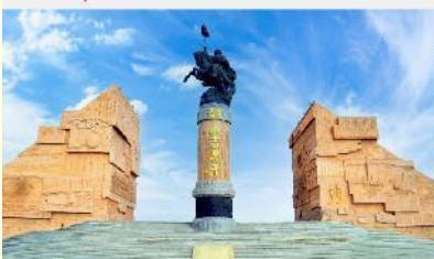
เขตท่องเที่ยวเจงกิสข่าน