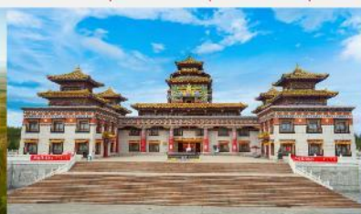
ทำเนียบพระลามะอุหลาน