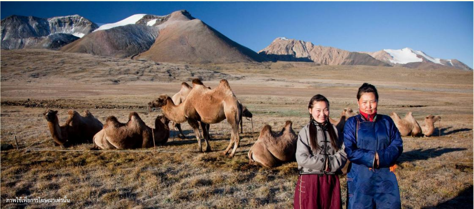
ภาพใช้เพื่อการโฆษณาเท่านั้น

นำท่านร่วมกิจกรรม พิธีต้อนรับแขกสไตล์มองโกล เป็นประเพณีโบราณที่มีมาช้านาน ชาวมองโกลมีอุปนิสัยที่รักเพื่อนฝูงและตรงไปตรงมาไม่เสแสร้ง เมื่อมีเพื่อนหรือแขกมาเยือนก็มักจะผูกมิตรอย่างจริงจัง และนำท่านร่วมกิจกรรม สวมใส่ชุดมองโกล สัมผัสพลังแห่งบรรพบุรุษ สวมเสื้อคลุมแบบดั้งเดิมที่มีสีสันสดใส ปักลวดลายอันประณีต คุณจะสัมผัสได้ถึงพลังแห่งบรรพบุรุษที่เคยปกครองดินแดนครึ่งโลก การสวมหมวกขนสัตว์ ผูกสายรัดเอว พร้อมเครื่องประดับเงินแท้ที่ส่องแสงระยิบระยับ จะทำให้ท่านเสมือนกลายเป็นนักรบแห่งทุ่งหญ้า พร้อมเครื่องประดับเงินแท้ที่ส่องแสงระยิบระยับ ของชนเผ่าที่เคยปกครองดินแดนครึ่งโลก เมื่อคุณยืนท่ามกลางทุ่งหญ้าไร้ขอบเขต