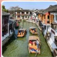
หมู่บ้านโบราณจูเจียเจียว + ล่องเรือ