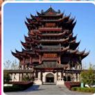
วัดดงหยวน