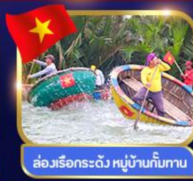
ล่องเรือกระด้ง หมู่บ้านกัมทาน