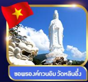
ชมพระอภิมหาอิม วัดหลินอึ้ง