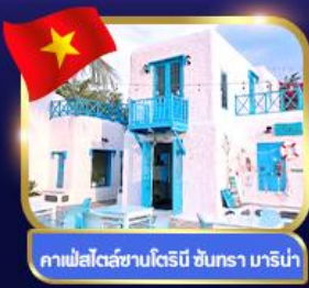
คาเฟ่สไตล์ซานโตรินี่ ชันทรา มาริน่า