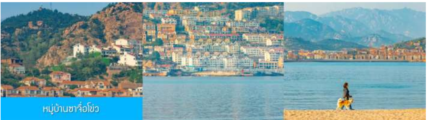
หมู่บ้านซาจื่อโข่ว

จากนั้นนำท่าน เดินทางสู่ คาเฟ่อัสดง 落日古堡 นำท่านชมปราสาทในเทพนิยาย ที่ตั้งตระหง่านอยู่ริมชายหาด นานาชาติเว่ยไห่ คาเฟ่ที่ออกแบบด้วยสถาปัตยกรรมสไตล์ยุโรป ตัดกับวิวทะเลสีคราม และที่นี่คือแม่เหล็กดึงดูดนักท่องเที่ยวมาเก็บบรรยากาศความสวยงามความโรแมนติก ( ตัวปราสาทเป็นร้านกาแฟ หากท่านต้องการเข้าไปด้านใน ต้องจ่ายค่าเครื่องดื่ม ตามเมนูของทางร้าน ซึ่งไม่รวมในอัตราค่าทัวร์ )