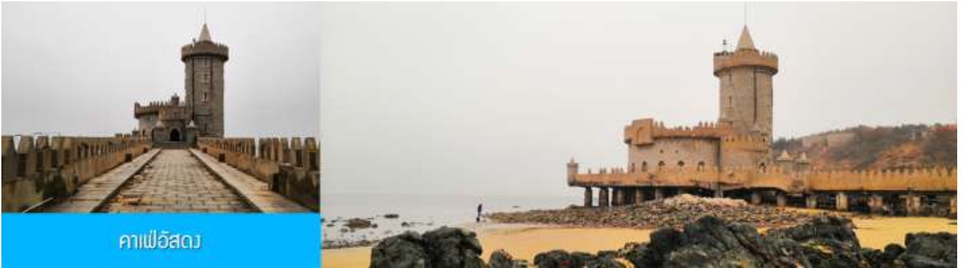
คาเฟ่อัสดง

จากนั้นนำท่าน เดินทางสู่ คาเฟ่อัสดง 落日古堡 นำท่านชมปราสาทในเทพนิยาย ที่ตั้งตระหง่านอยู่ริมชายหาด นานาชาติเว่ยไห่ คาเฟ่ที่ออกแบบด้วยสถาปัตยกรรมสไตล์ยุโรป ตัดกับวิวทะเลสีคราม และที่นี่คือแม่เหล็กดึงดูดนักท่องเที่ยวมาเก็บบรรยากาศความสวยงามความโรแมนติก ( ตัวปราสาทเป็นร้านกาแฟ หากท่านต้องการเข้าไปด้านใน ต้องจ่ายค่าเครื่องดื่ม ตามเมนูของทางร้าน ซึ่งไม่รวมในอัตราค่าทัวร์ )