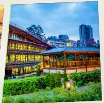
ห้องสมุดเป่ย์โถว