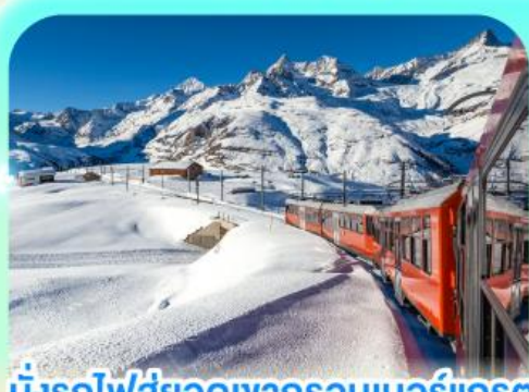
นั่งรถไฟสู่ออดเขากรอนเนอร์เกรต