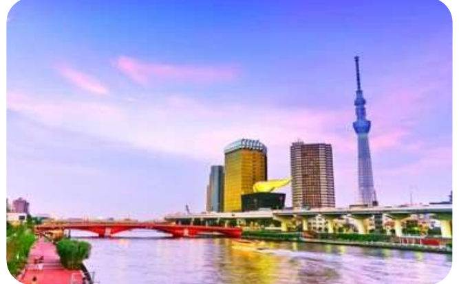
แม่น้ำสุมิดะ

สักการะ วัดมัตสึจิยามะโชเต็น หรือ "วัดหัวไชเท้า" เป็นวัดเก่าแก่ในย่านอาซากุสะ ตั้งอยู่บนเนินเขาเล็ก ๆ ใกล้แม่น้ำสุมิดะ จุดเด่นคือเป็นวัดที่ขึ้นชื่อเรื่อง "ขอพรด้านการเงิน โชคลาภ และความสำเร็จในธุรกิจ" ส่วนไฮไลต์สำคัญของวัดนี้ คือ ไตคอน หรือ หัวไชเท้า สัญลักษณ์ศักดิ์สิทธิ์ คนที่นี้เชื่อว่าไตคอนช่วย "ชำระล้างสิ่งไม่ดี" และนำโชคลาภเข้ามา นักท่องเที่ยวมักนำไตคอนไปถวายเพื่อขอพร