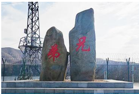
ป้ายพรมแดนจีนเกาหลีและแท่งศิลาสองพี่น้อง