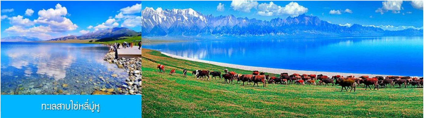
ทะเลสาบไซหลี่มู่หู

พักที่ XIHAI LIJING HOTEL ระดับ 4 ดาวท้องถิ่นหรือเทียบเท่าในเมืองปัวเล่