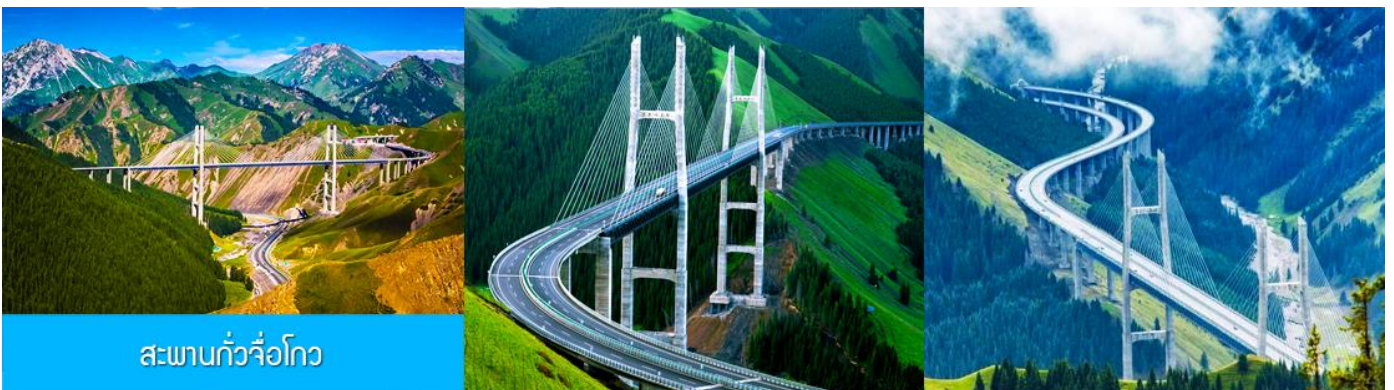
สะพานกั๋วจื่อโกว

หลังอาหารนำท่านเดินทางโดยรถบัสสู่ ตำบลนำลาตี 那拉提 (ระยะทาง 300 กม. ใช้เวลาเดินทางราว 4 ชั่วโมง)