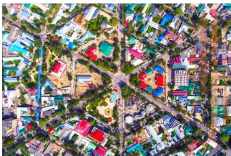
ถนนหกแฉก

จากนั้นนำท่านเดินทางสู่ เมืองอิหนิง 伊宁 (ระยะทาง 200 กม. ใช้เวลาเดินทางราว 3 ชั่วโมง)