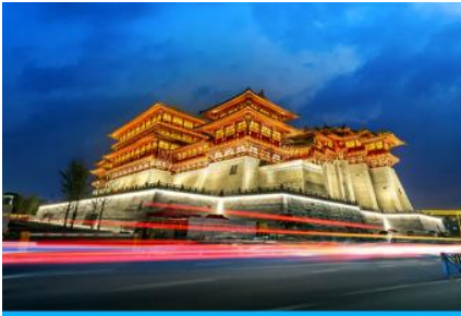
นครลั่วหยาง