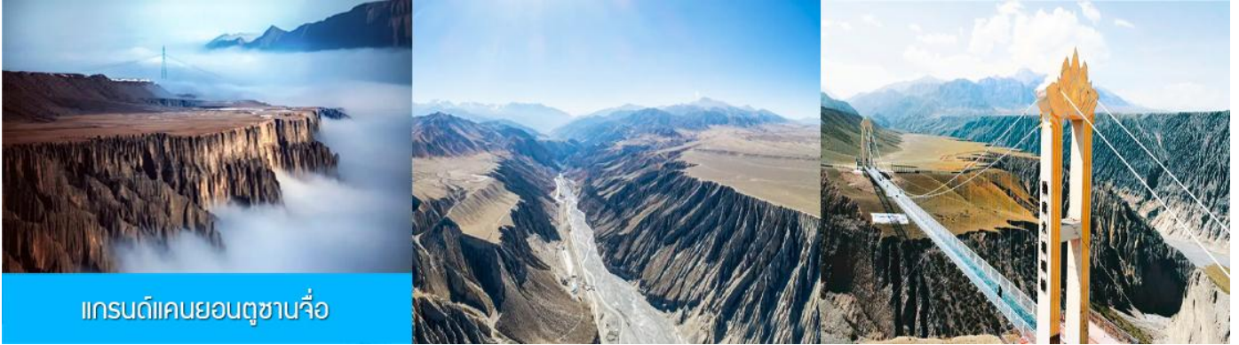
แกรนด์แคนยอนตูซันจื่อ