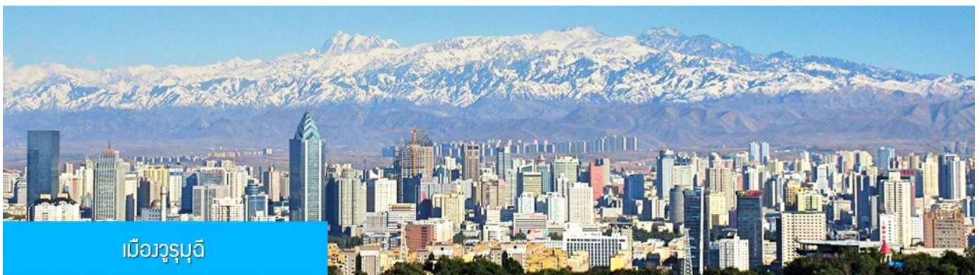
เมืองวูรุ่หมู่