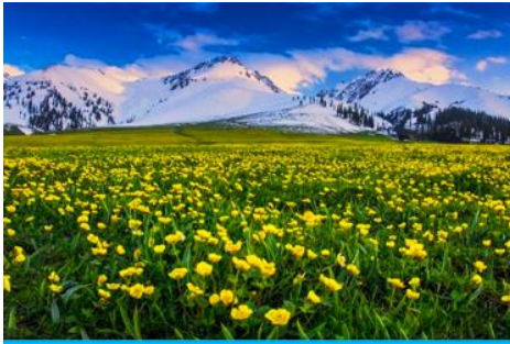
ทุ่งหญ้าลวยฟ้านาลาดิ

พักที่ WAN SEN HOTEL ระดับ 4 ดาวท้องถิ่นในตำบลนาลาดิ