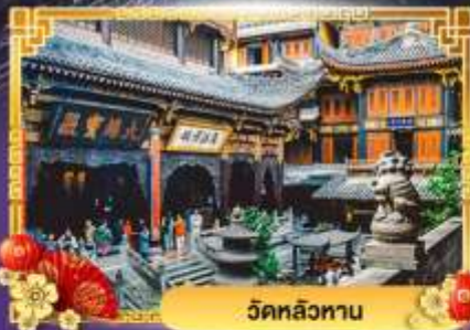
วัดหลิวทาน