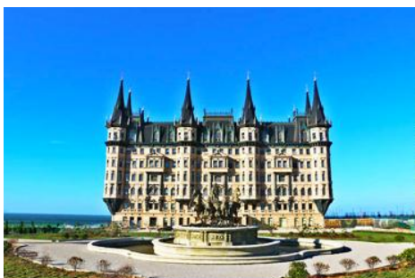
คฤหาสน์เหวินเจิง

นำท่านไปเยือนเมืองท่าสุดโรแมนติคสไตล์ยุโรป ท่าเรือชาวประมง ให้ท่านได้ชมสถาปัตยกรรมสไตล์อเมริกาเหนือ และ ยุโรป ที่ตั้งอยู่ในผืนแผ่นดินจีน ณ เมืองเยียนไถ เก็บบรรยากาศลมทะเล และเก็บรูปกับอาคารหลังคาสีสดใสเป็นฉากหลัง ที่เต็มไปด้วยมนต์เสน่ห์และความทรงจำที่สวยงาม ให้ท่านเก็บภาพความสวย