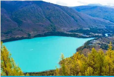
ศาลาชมปลา