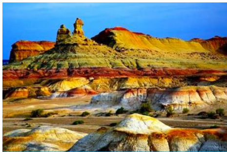
เมืองผีวูเอ้อเหอ

พักที่ XI BU WU ZHEN HOTEL ระดับ 4 ดาวท้องถิ่นหรือเทียบเท่าในเมืองวูเอ้อเหอ