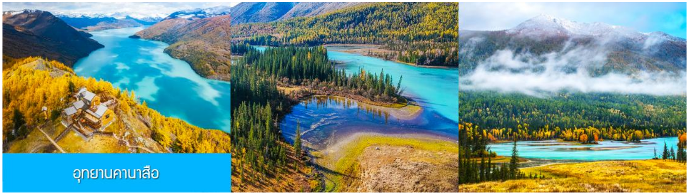
อุทยานคานาสือ