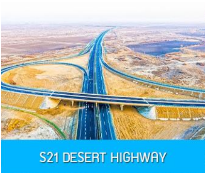
S21 DESERT HIGHWAY