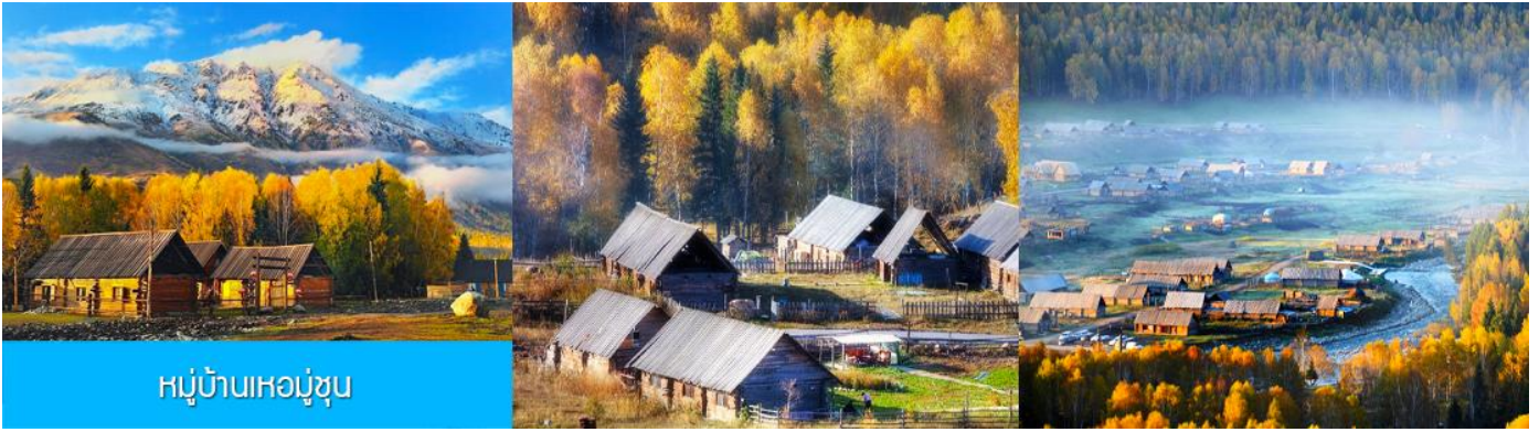
หมู่บ้านหอมู่ซุน