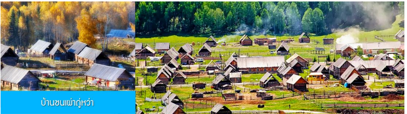
บ้านชนเผ่าอุหว่า

หลังอาหารนำท่านเดินทางสู่ หมู่บ้านหอมู่ซุน (ระยะทาง 110 กม ใช้เวลาเดินทางราว 2 ชั่วโมง) นำท่านเที่ยวชม หมู่บ้านหอมู่ซุน 禾木村 หมู่บ้านโบราณที่ขึ้นชื่อด้วยทัศนียภาพที่สวยงามท่ามกลางความสงบ เป็นชุมชนของชนเผ่าอุหว่าที่เป็นชนพื้นเมืองในเขตมองโกเลีย ที่เป็นชนกลุ่มน้อยที่เก่าแก่ที่สุดในจีนพำนักอาศัยอยู่ หมู่บ้านแห่งนี้ ตั้งอยู่ในเขตอุทยานคานาสือ ทางฝั่งตะวันตกเฉียงใต้ของเทือกเขาอัลไต หมู่บ้านนี้ได้รับการขนานนามว่าเป็นหมู่บ้านชนเผ่าที่มีเอกลักษณ์โดดเด่น ถูกจัดลำดับเป็นหนึ่งในหกหมู่บ้าน โบราณที่ดีที่สุดในหนึ่งแปดสถานที่ถ่ายทำภาพยนตร์ยอดเยี่ยมของจีน มีแม่น้ำหอมู่ไหลผ่านหมู่บ้าน ด้วยทัศนียภาพที่สวยงามท่ามกลางความสงบแห่งธรรมชาติ หมู่บ้านแห่งนี้มีช่างภาพ นักวาดเขียนและนักท่องเที่ยวต่างมาเยือนอย่างไม่