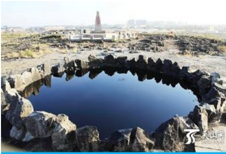
บ่อน้ำมันสีดำ

ระหว่างทางแวะรับประทานอาหารกลางวัน ณ ภัตตาคาร (เมนูอาหาร 80 หยวน/หัว) (11)