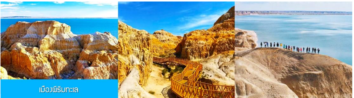
เมืองฝิริมทะเล

รับประทานอาหารกลางวัน ณ ภัตตาคาร (เมนูอาหาร 80 หยวน/หัว) (2)