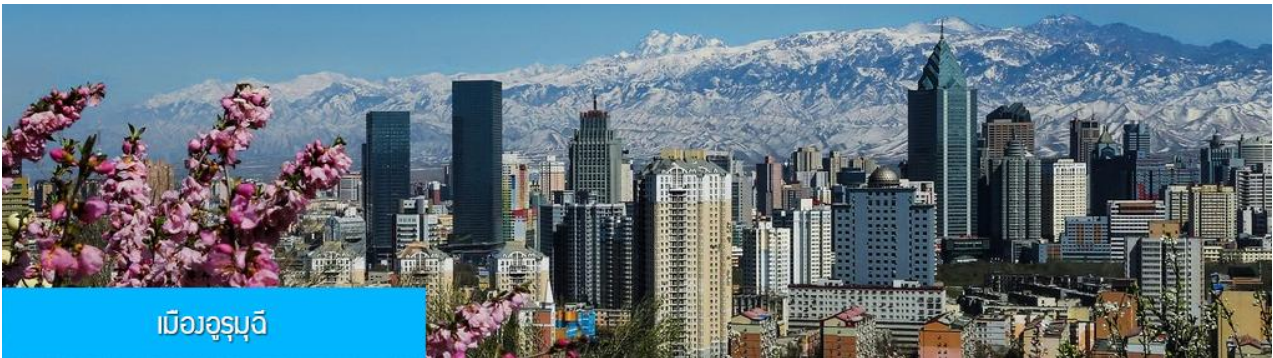
เมืองอูรูมูฉี

พักที่ MERCURE HOTEL โรงแรมระดับ 4 ดาวห้องถึงหรือเทียบเท่าในเมืองอูรูมูฉี