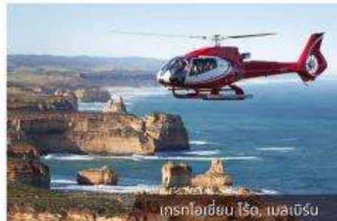
เฮลิคอปเตอร์, เมลเบิร์น