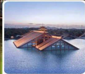
พิพิธภัณฑ์ไดน้ำ กวางฟู่หลิน