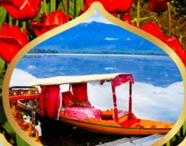
ล่องเรือชิคาร่า