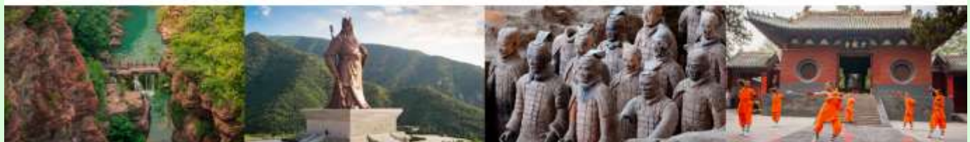
อุทยานสวรรค์หยุนโตซาน