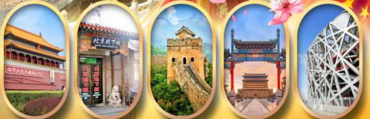
จัสมุติสเทียนอันเหมิน เมืองโบราณใต้ดิน กำแพงเมืองจีน ถนนคนเดินเจียมเหมิน ผ่านชมสนามกีฬาโอลิมปิก