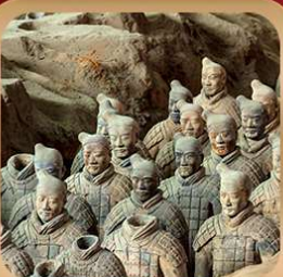
“สุสานจีนซีฮ่องเต้”