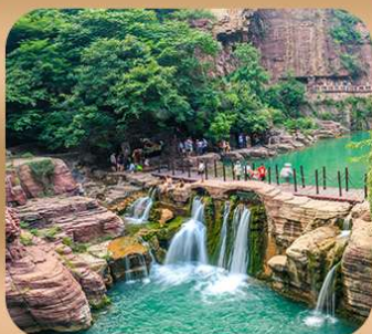
“อุทยานหยุนไท่ซาน”

ชมถ้ำหลงเหมิน มรดกโลกที่เมืองลั่วหยาง • สุสานจีนซีฮ่องเต้ • ศาลเจ้ากวนอู วัดเส้าหลิน + ป่าเจดีย์ + ชมโชว์กังฟู • เมืองโบราณลั่วอี้ • อุทยานหยุนไท่ซาน เจดีย์ห้าพันปี • ถนนวัฒนธรรมต้าถัง • ถนนคนเดินอิสลาม • จัตุรัสหออระขิง