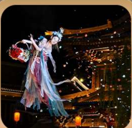
“เมืองโบราณลั่วอี้”

ชมถ้ำหลงเหมิน มรดกโลกที่เมืองลั่วหยาง • สุสานจีนซีฮ่องเต้ • ศาลเจ้ากวนอู วัดเส้าหลิน + ป่าเจดีย์ + ชมโชว์กังฟู • เมืองโบราณลั่วอี้ • อุทยานหยุนไท่ซาน เจดีย์ห้าพันปี • ถนนวัฒนธรรมต้าถัง • ถนนคนเดินอิสลาม • จัตุรัสหออระขิง