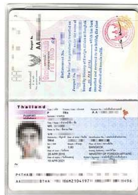
Passport เต็ม 2 หน้า