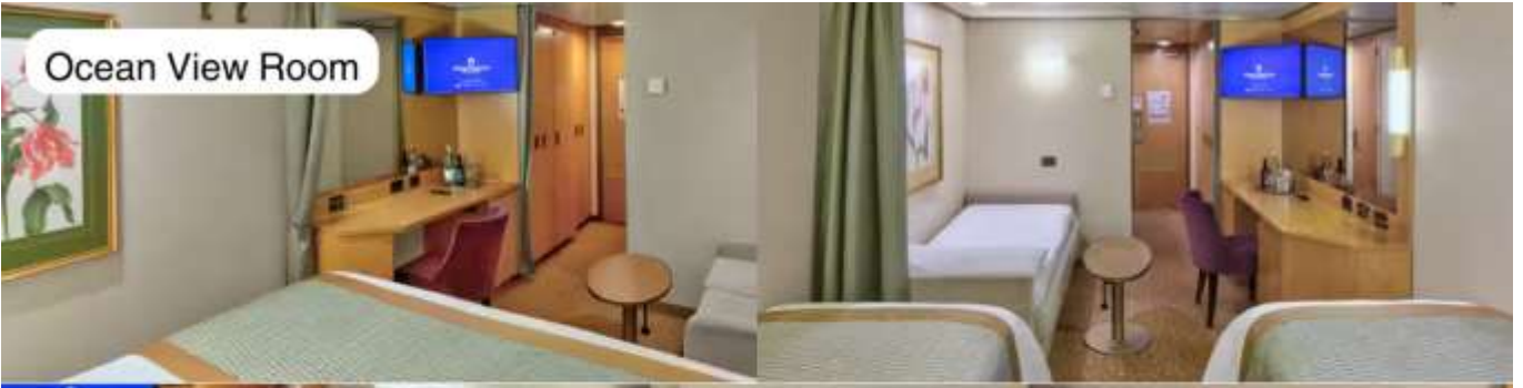
Ocean View Room