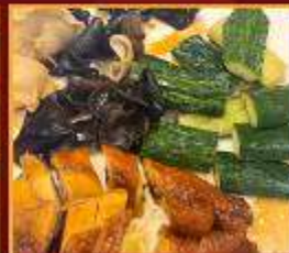
ไก่ แดงกวา เห็ดหูหนู