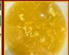
ซุปรข้าวโพด