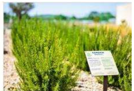
The Mediterranean Garden