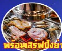
พร้อมเสิร์ฟปิ้งย่างเกาหลี